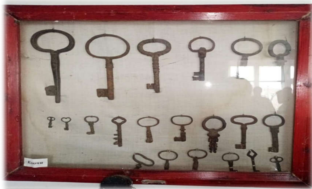
Фотографии из школьного музея декабристов.