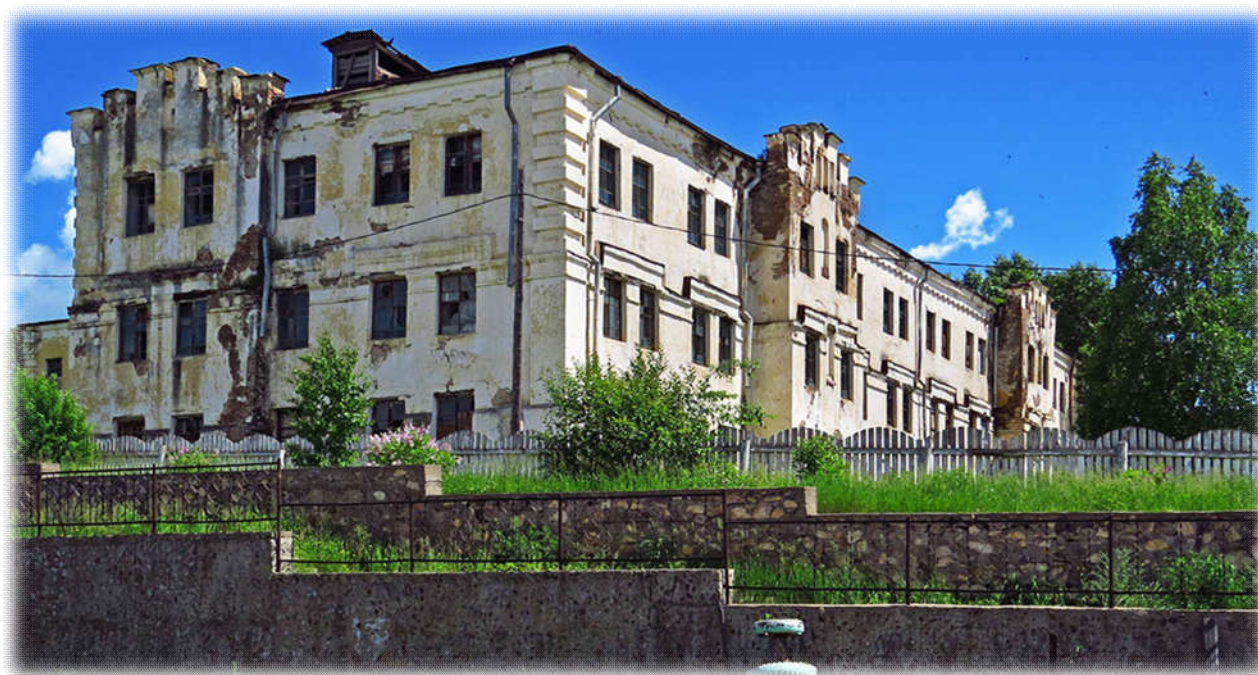
Горно-Зерентуйская каторжная тюрьма , настоящее время